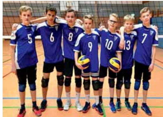
Neuer Wind mit neuen Trikots!

Parallel fanden in Hameln die Regions-meisterschaften der Jungen U18 statt. Die Mannschaft konnte wertvolle Erfahrungen sammeln, schaffte es aber nicht, einen Sieg einzufahren und belegte deshalb den 4. Platz.